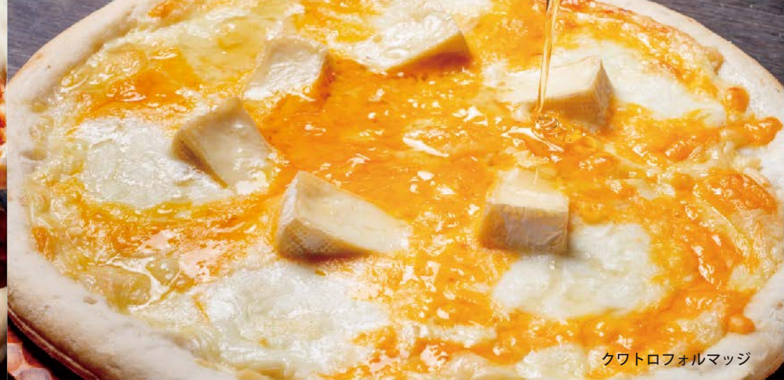
クワトロフォルマッジ