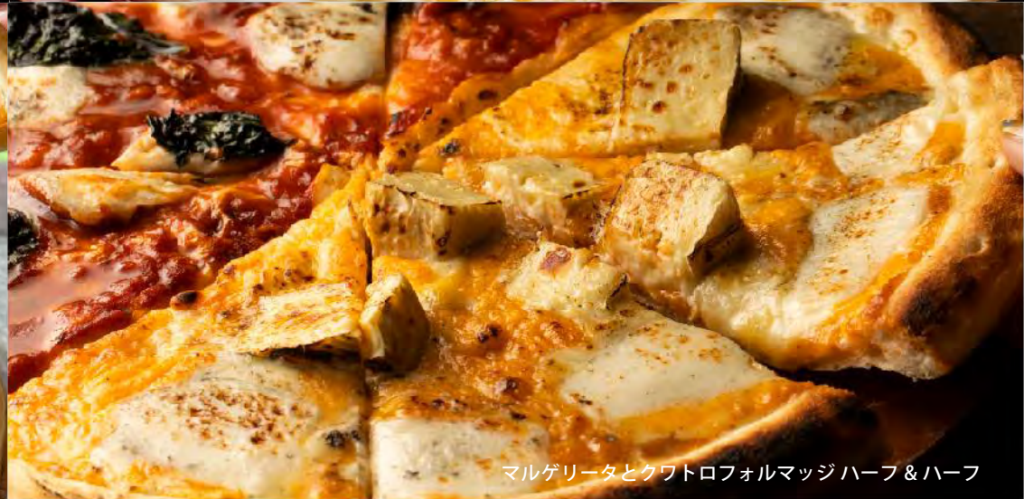
マルゲリータとクワトロフォルマッジ ハーフ & ハーフ