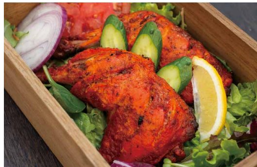
Tandoori chicken タンドリーチキン ¥2,750(税込)