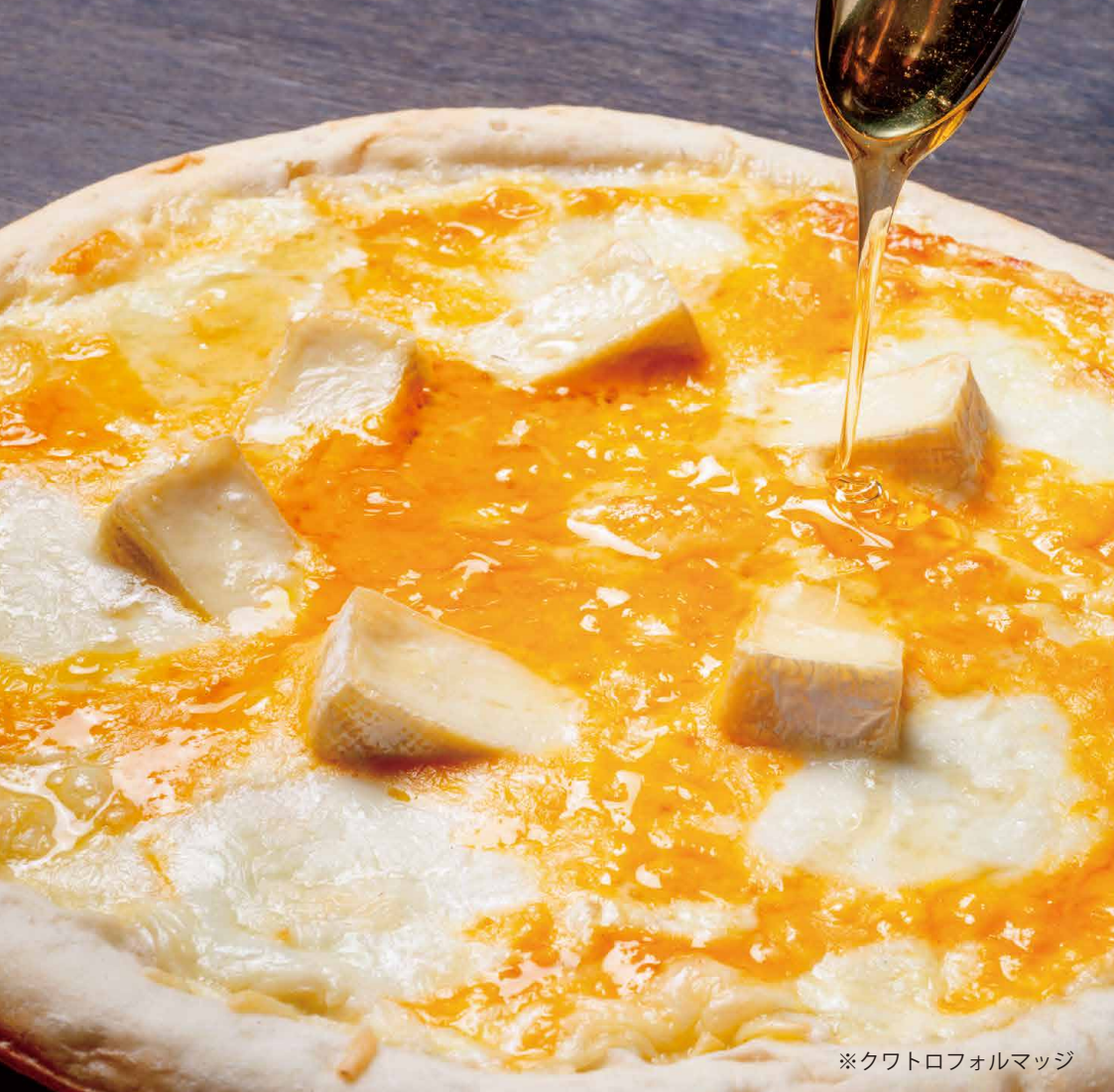
※クワトロフォルマッジ