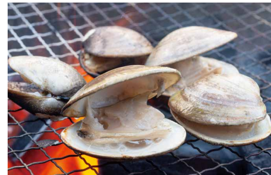
Clam 千葉県産地ハマグリ 時価 (10枚で目安 ¥5,000 ~ ¥6,600)