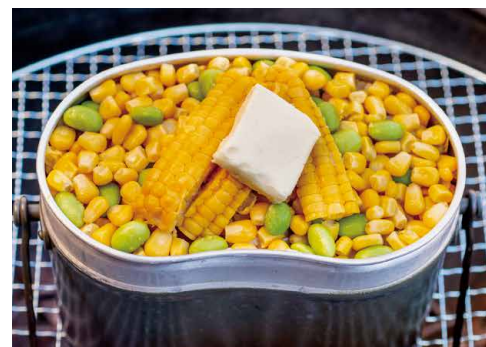
期間限定 ※2024年9月末ご宿泊分まで受付 Seasoned rice with edamame and corn 枝豆とコーンのバター醤油炊き込みご飯 (約2人前) ¥2,200(税込)