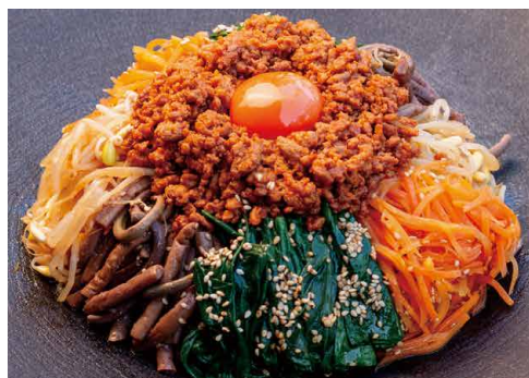
Bibimbap ビビンバ (約2人前) ¥2,200(税込)