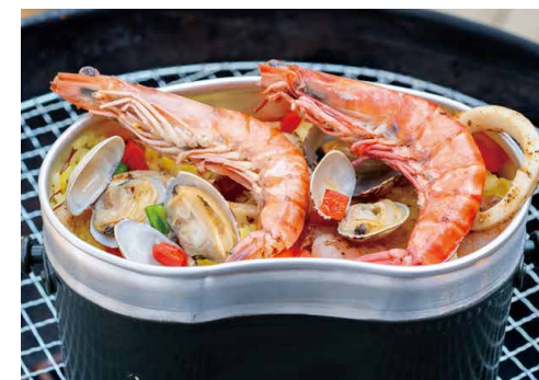
Paella 飯盒パエリア (約2人前) ¥2,200(税込)