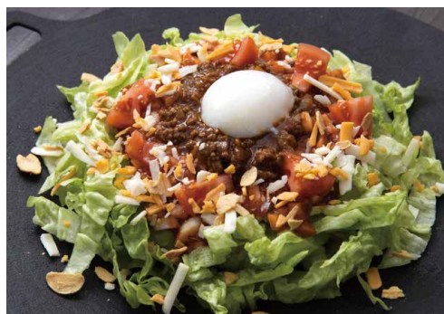
Taco Rice タコライス (約2人前) ¥2,200(税込)