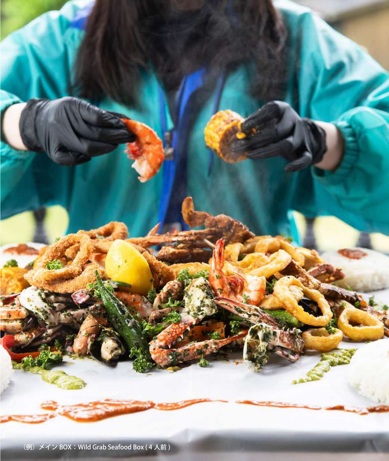
(例) メイン BOX : Wild Grab Seafood Box (4人前)