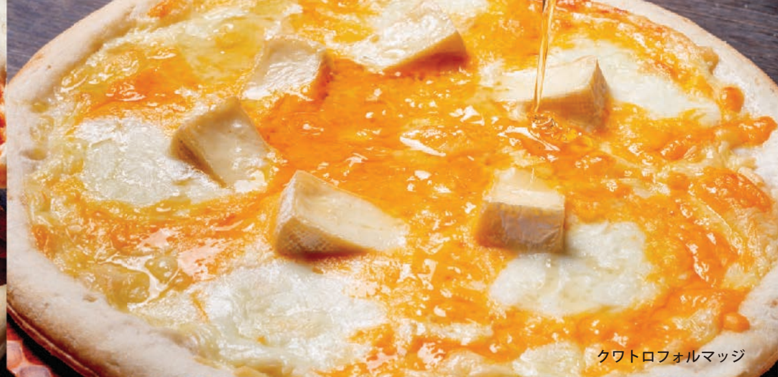
クワトロフォルマッジ