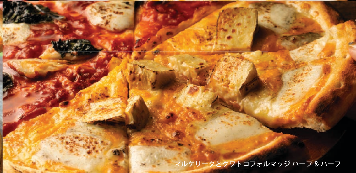
マルゲリータとクワトロフォルマッジ ハーフ & ハーフ