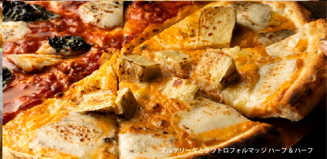
マルゲリータとクワトロフォルマッジ ハーフ & ハーフ