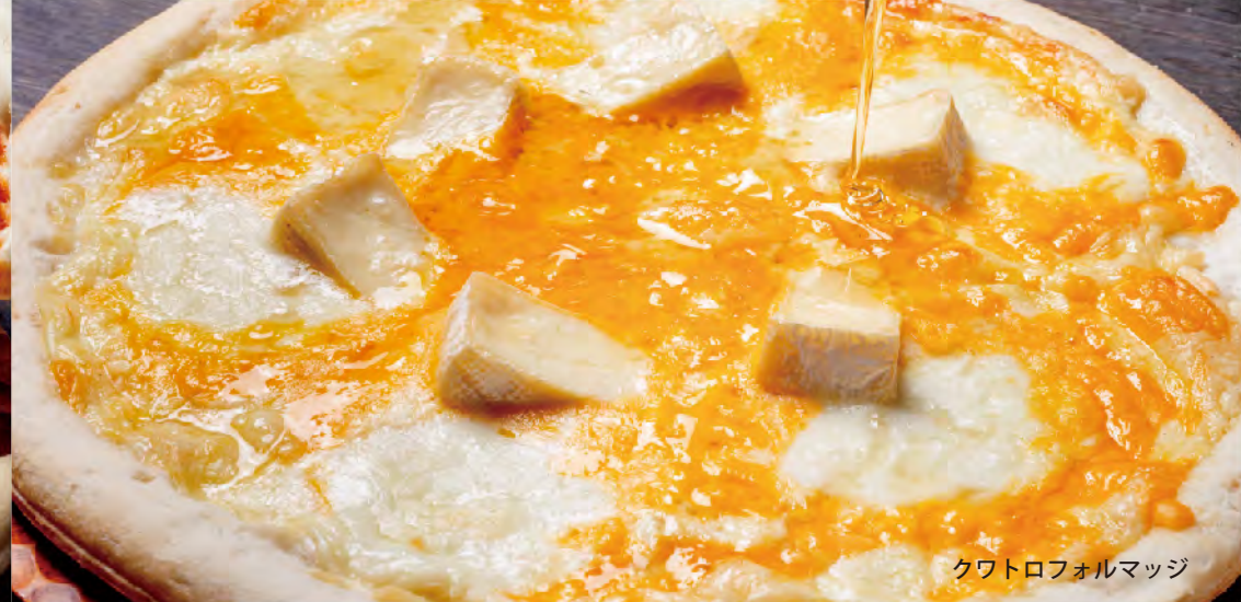
クワトロフォルマッジ