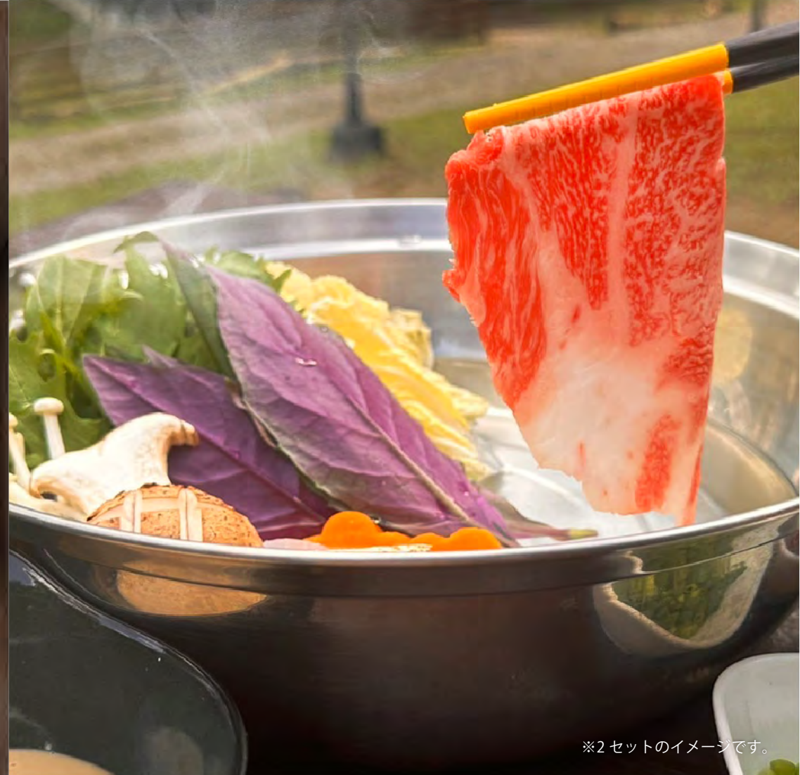
※2セットのイメージです。